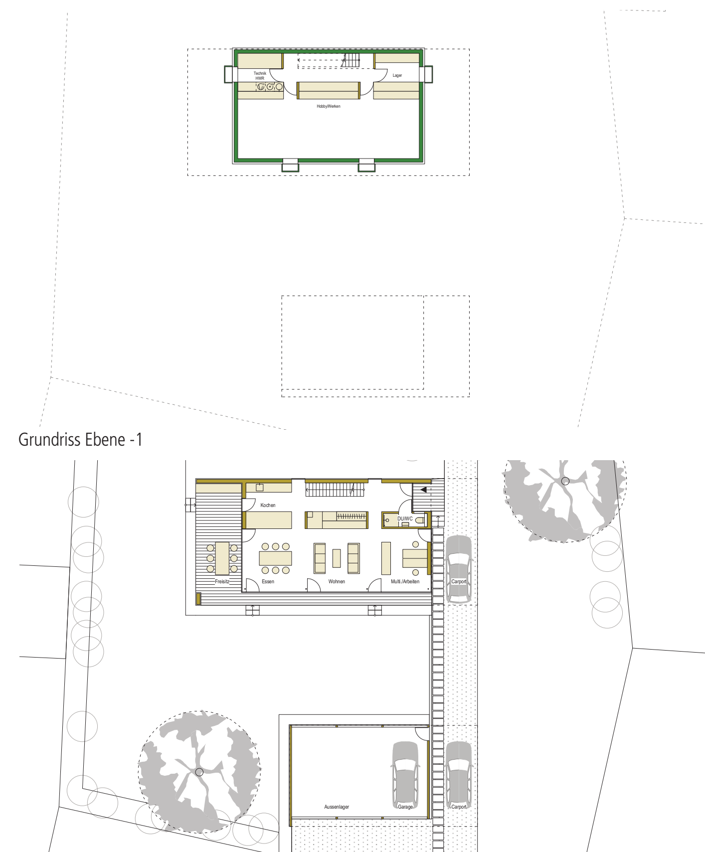
Grundriss Ebene 0